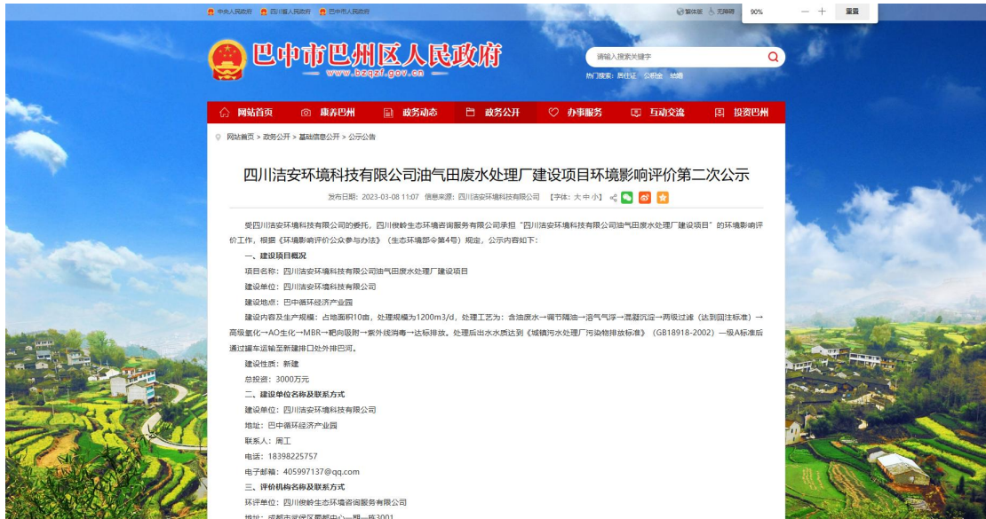
图 3 项目第二次公示截图（网络平台）