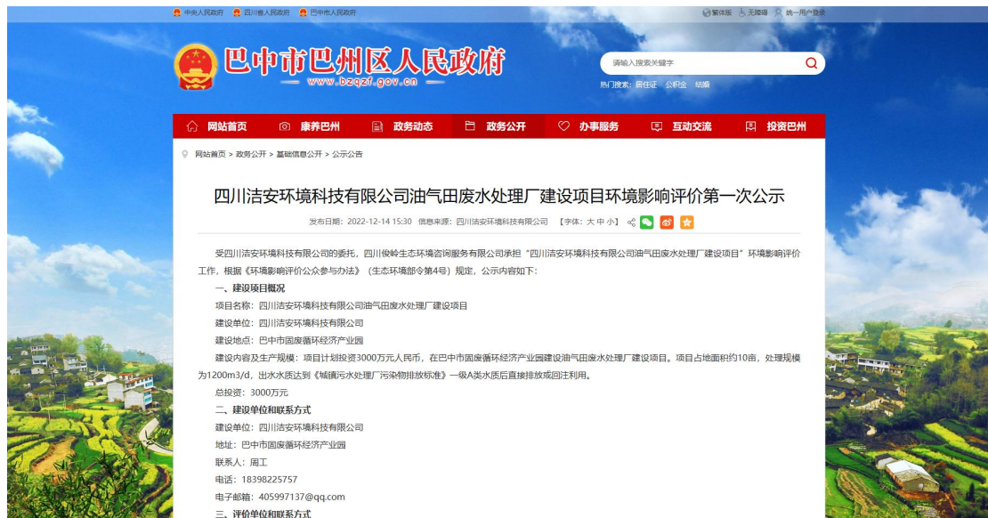
图1 项目第一次网上公示截图

本项目选取的首次公开载体为网络公示，公示网站为巴州区人民政府网站，符合《环境影响评价公众参与办法》（生态环保部第4号令）“在建设项目所在地公共媒体网站或建设项目所在地相关政府网站公开”的要求，其公示时间为2022年12月14日至征求意见稿完成，其网站截图及附件如下。